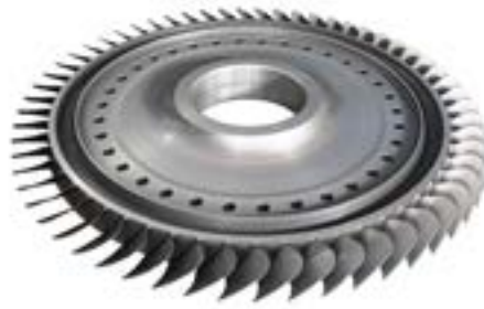
ROTOR AUS INCONEL

Superlegierungen werden häufig in Teilen von Gasturbinenriebwerken verwendet, die hohen Temperaturen ausgesetzt sind. Sie verlangen eine hohe Festigkeit, eine ausgezeichnete Beständigkeit gegen hohe Temperaturen, Phasenstabilität sowie Resistenz gegen Oxidation, Materialermüdung und Korrosion. Superlegierungen erzeugen jedoch während des Bearbeitungsprozesses hohe Temperaturen, was die Zerspanung erschwert.