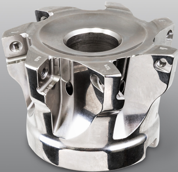
BISHERIGES ERSCHEINUNGSBILD (poliert)